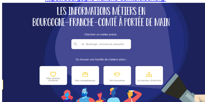
La page d'accueil de Cléor Bourgogne-Franche-Comté

https://bourgogne-franche-comte.cleor.org/