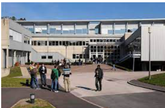
Crous du Creusot