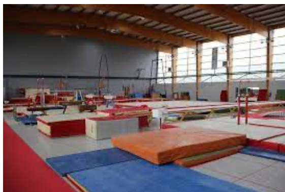
Gymnase Jean Bouveri Montceau les Mines