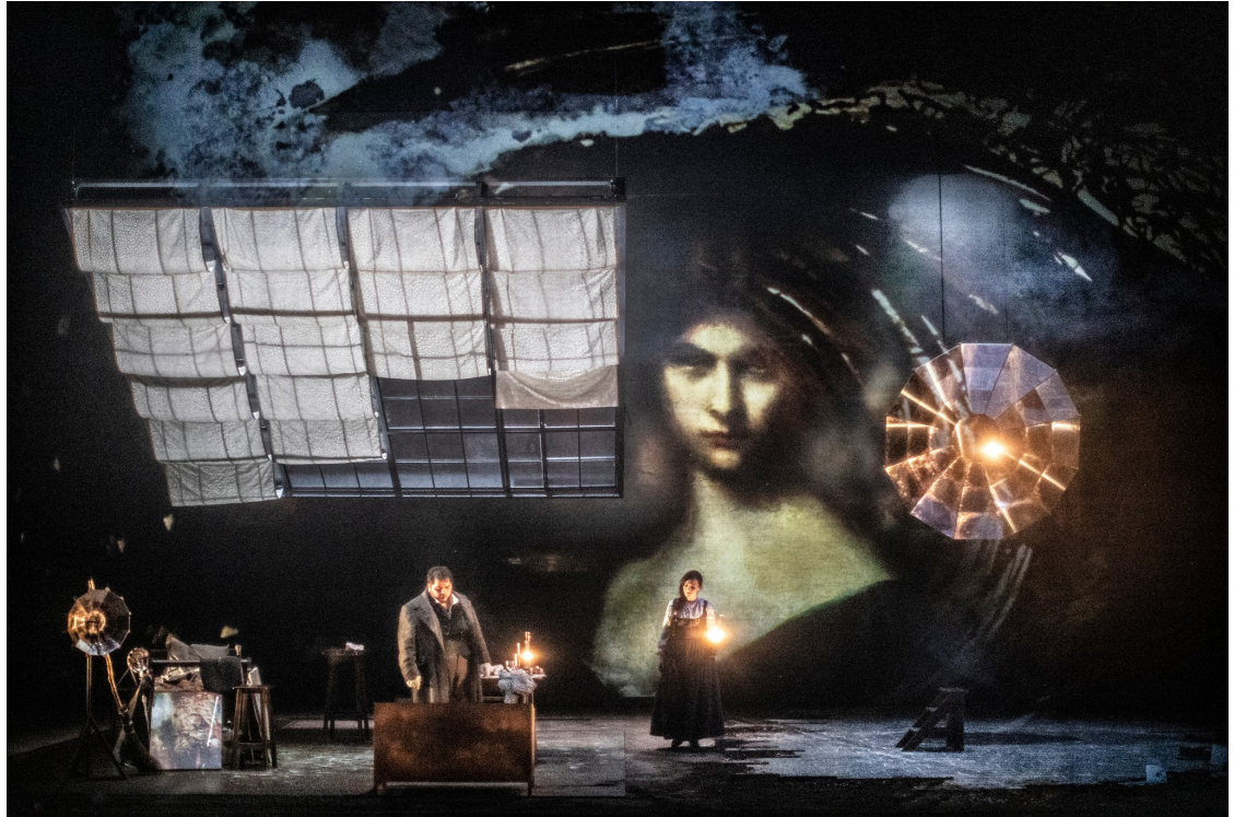
La Bohème