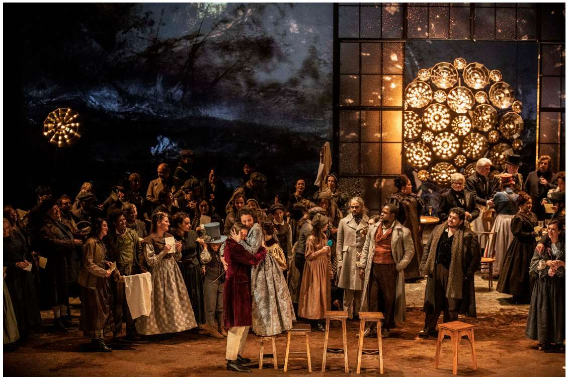
La Bohème